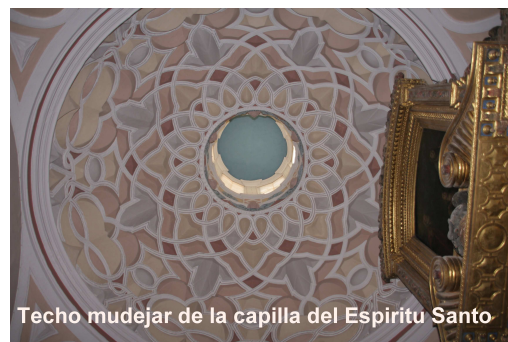
Techo mudejar de la capilla del Espíritu Santo

La mejor forma de proteger nuestro patrimonio es, primero la catalogación y luego su difusión: por una parte se acredita la propiedad, por otra, hace muy difícil su venta