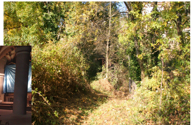
Arriba: camino del balsón. Izda: cambio tarima iglesia