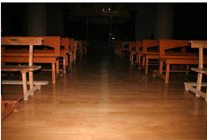
NUEVA TARIMA DE LA IGLESIA