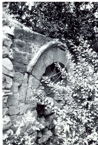
Arco románico de la ermita de San Miguel en su ubicación original